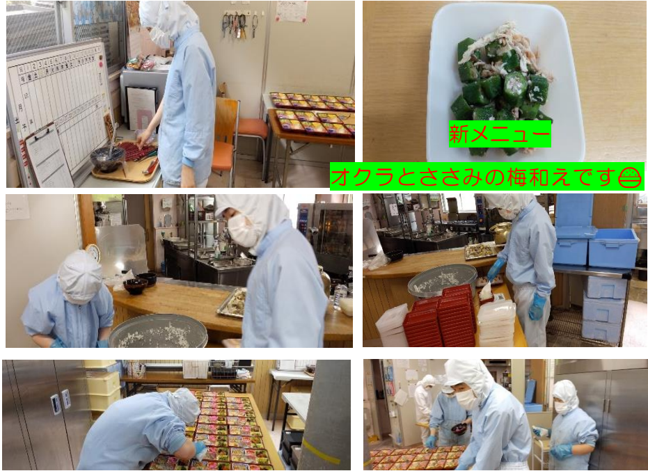
◆皆さん一生懸命お仕事されています♪

夏野菜には色々な種類がありますが、その中から「オクラ」について調べてみました。 オクラの特徴でもあるネバネバの成分は水溶性食物繊維で血中コレステロールを減らし、血圧を下げる作用や整腸作用があります。またその他の免疫力をアップさせる働きもあります。 スーパードライ等で選ぶときには緑色が濃く、切り口やヘタに黒ずみがない物。産毛が多くさやの先がピンとしてまっすぐなものが新鮮です。育ちすぎると苦みが出るので、少し小ぶりなくらいが美味しいとされています。 料理方法は色々ありますが、ごま和えやおかか和え、長芋梅肉和えなどが十人十色よく出ます。オクラと長芋の相性がいいみたいで長芋梅肉和えがオクラの美味しさを倍増してくれるかもしれせんね。 十人十色の7月の献立の中にも新メニューのオクラとささみの梅和えとオクラのおかか和えが入っています。美味しく召し上がっていただければよう頑張りますのでよろしくお願いします。