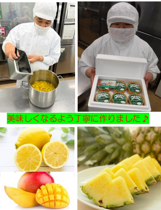
美味しくなるよう丁寧に作りました♪