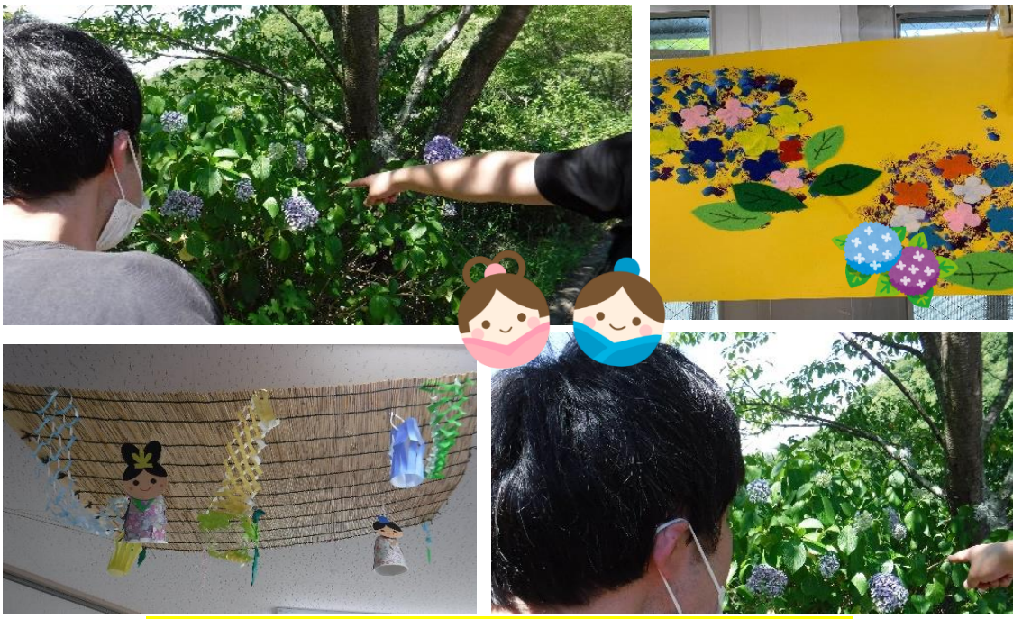
◆アジサイ見学に七夕飾り作り 風流ですね♪

暑さも本格的になってきましたが、療育班では季節に合わせた活動を行っています。先日は吉野山のアジサイロードを訪れました。頂上に向かう道中には青や紫など鮮やかなアジサイが出迎えてくれ、到着後は散歩をしながらアジサイを眺め、青空も相まって爽やかな時間を過ごすことができました。 また、療育班の天井にはみんなで作った七夕飾りがあります。利用者さんが折り紙のちぎりを絵を使って彦星様や織姫様の着物を作りました。他にも輪飾りや天の川なども職員と協力して作ることができ、素敵な七夕飾りができました。7月7日の七夕の日に向けての準備も着々と進み、利用者さんや皆様の願い事が叶えばいいなと思う初夏のこの頃です。