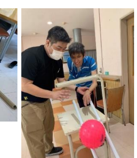
◆倒れそうで倒れないよ～