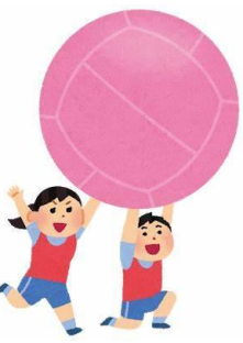
◆上手にはいるかな♪