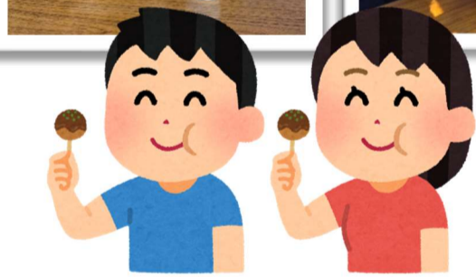
▲美味しいたこ焼きでにっこり😊