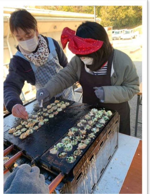
▲慣れない手つきで一生懸命作ってくれました!