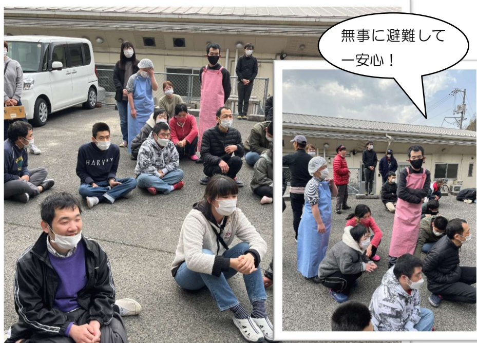
▲皆さん落ち着いて避難することが出来ました！

今年度、2回目となる避難訓練を3月5日に実施しました。当日は土曜開所日で、利用者さんはロビーに集まって先日実施した冬の行事の振り返りをしていました。その中で「火事だ〜！」と調理場から大きな声が聞こえてきました。非常ベルが鳴る中、職員は利用者さんを誘導しましたが、皆さんとても落ち着いて避難することができていました。毎年実施していることもあるが、職員の急な声掛けにもすぐ行動してくれました。避難後は水消火器を使って消火器訓練を行いました。去年は準備した水消火器の中身がないハプニングがあり、消火器訓練を行えませんでした。今年度は、3本の水消火器を使用し、職員・利用者さんに体験してもらいました。目標物に狙って消火器を使用することが意外に難しく、実際に訓練して良かったと思います。