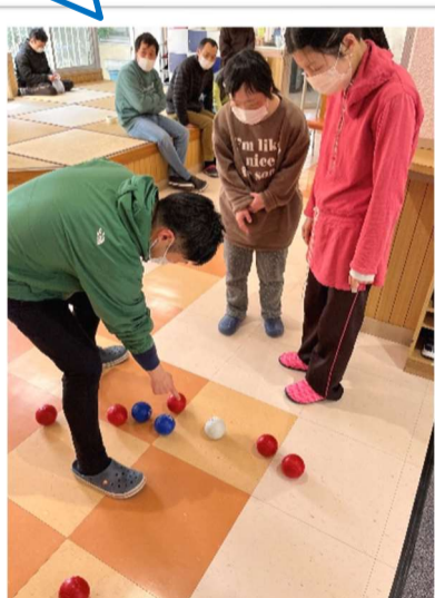
▲勝ち抜きポッチャは大盛り上がりでした!