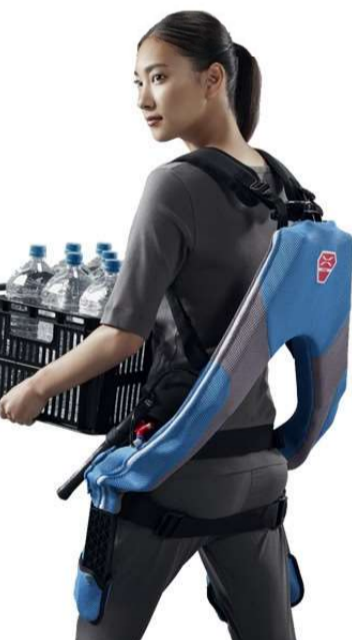
▲重たい物を持つ際にサポートしてくれます！

この度、介護現場の負担を軽減することを目的に株式会社イノフエスの「マッスルスーツ」の導入を検討する為、実際にスーツの使用テストをさせて頂いていただきました。Webで使用方法の説明を聞きながらスーツを装着して実際に重たい物を持ってみると、確かに持ち上げる際にはスーツがサポートしてくれ腰の負担が少なく感じられました。数日間現場での使用テストを行った結果、使用場面が限られる等の理由で導入は見送りとなりましたが、使い次第では福祉の現場で有効な物であると感じました。働く現場での腰への負担軽減から、日常のちょっとした力仕事のサポートまで幅広く使用することができ、介護現場・農作業など、重いものを運ぶ様々なシーンで活躍が期待できるのかな？と未来を感じるスーツを着て感じました。皆様も一度スーツを試してみても如何でしょうか。