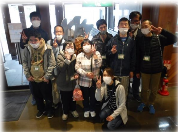
▲鞆の浦の阿藻珍味に来たよ!!