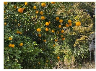
▲立派なゆずが実っています。