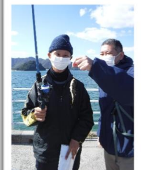
▲頑張って釣りました。▲