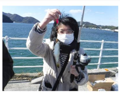
▲フグが釣れました!!