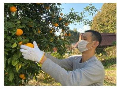
▲一つずつ丁寧に収穫しています。