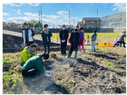
▲掘り方を教えてもらい・・・