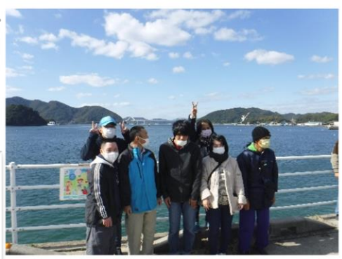
▲沼隈町の防波堤に来たよ!!