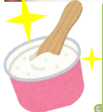
この夏のお供にぜひ!

みなさんの期待に応えられるように、そして多くの方にアルコシヤラーのシエラートを食べていただけるように日々精進してまいります。皆様からのご注文、お待ちしておりますー!