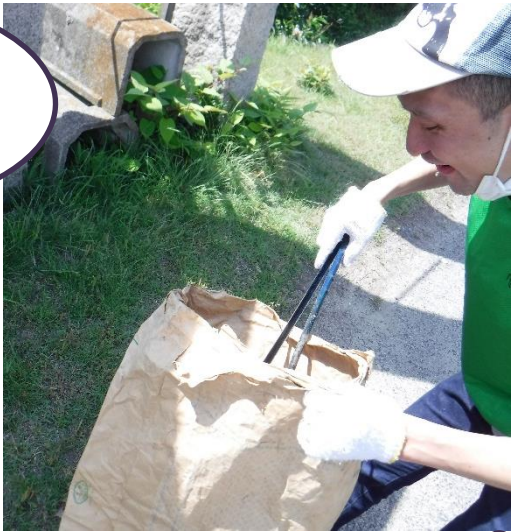
小さなゴミも見逃しません♪