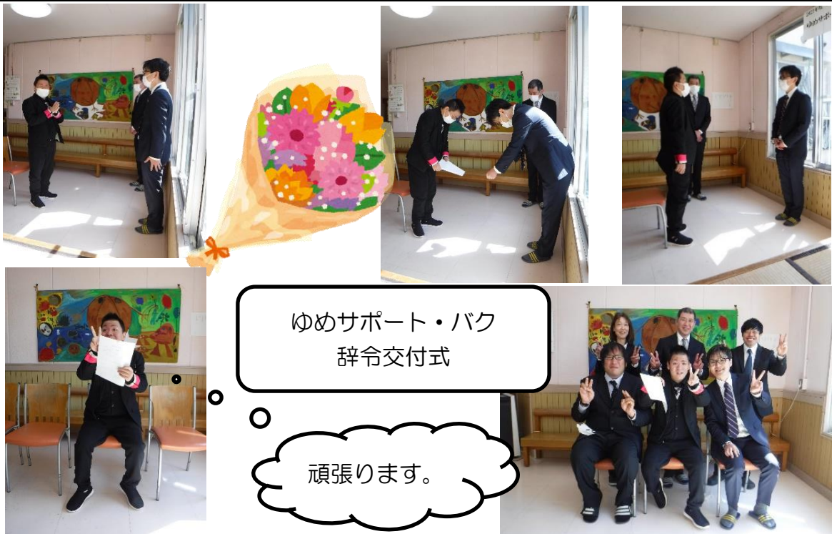
ゆめサポート・バク 辞令交付式

今回の辞令交付式は、新たな利用者さんを迎えられるとともに、施設職員との関係を築く最初の機会となりました。今後は作業を通じて働き甲斐、やり甲斐を感じ充実した生活を送り、笑顔あふれる日々を過ごしてもらえよう、職員一同で支援していきたいと思っております。