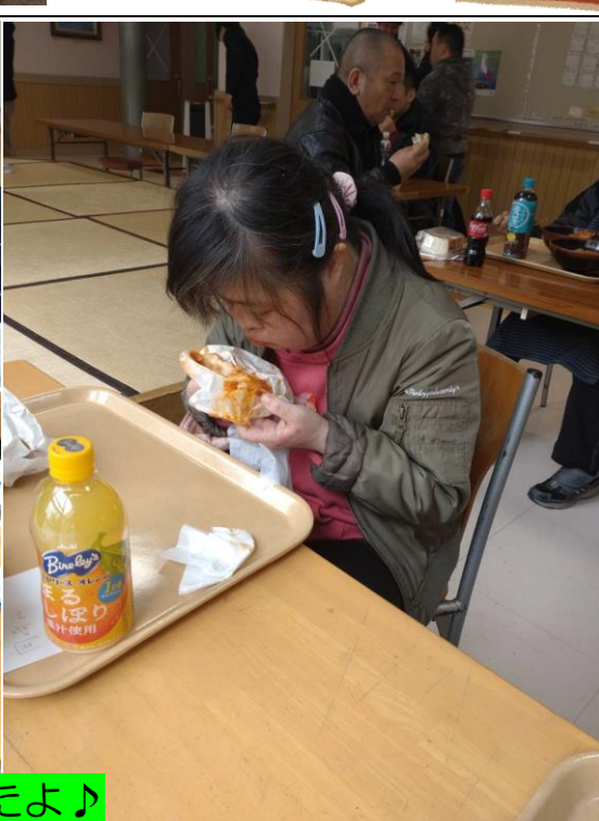
モスバーガー美味しかったよ♪