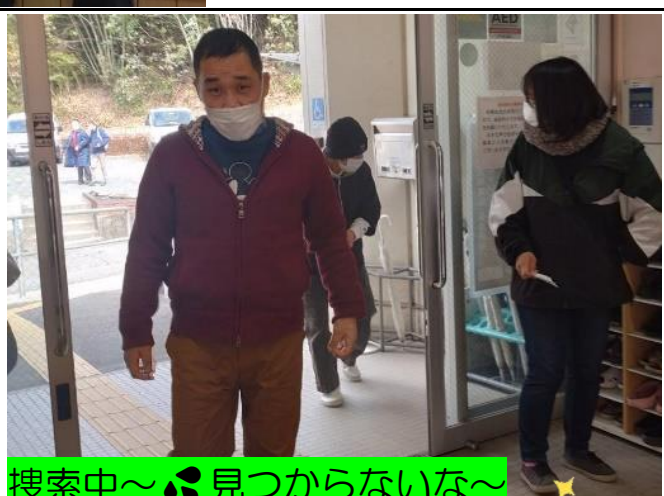
搜索中〜💧見つからないな〜