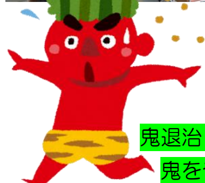
鬼退治!! 鬼をやっつけろ!!