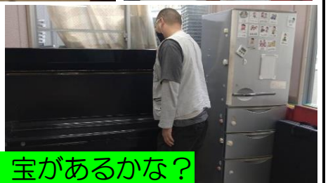
どこに、宝があるかな?