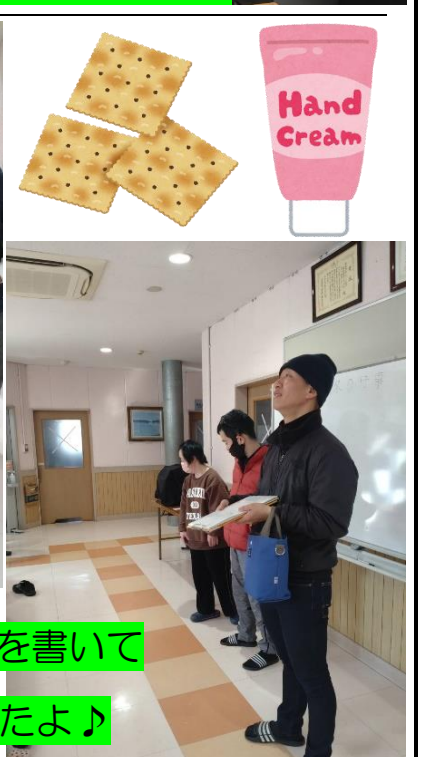
箱に入れたら最後に貰えたよ♪