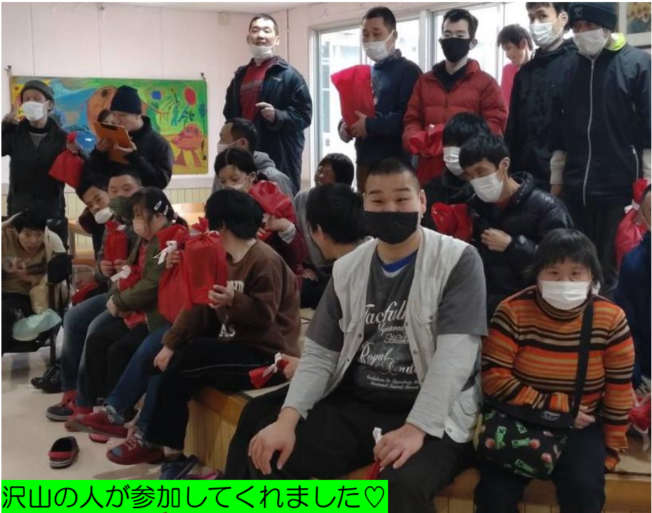
沢山の人に参加してくれました♡

午後からはよいよ鍵（紙）と宝物の交換です。発表は、自治会副会長が担当し、「〇〇番、〇〇さん」と元気よく発表し「お菓子」「入浴剤」「ハンドクリーム」など皆さんそれぞれの宝物を手にしていました表情は明るく見ている職員も笑顔になりました。今回の宝探しは初めての試みでしたが来年度も自治会役員さんと一緒に楽しい行事を考えて行きたいと思えます。役員の皆さん・参加された利用者の皆さんお疲れ様でした。