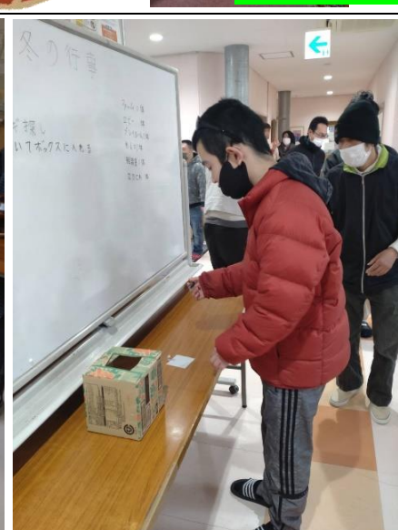
宝を見つけたら紙に名前を書いて