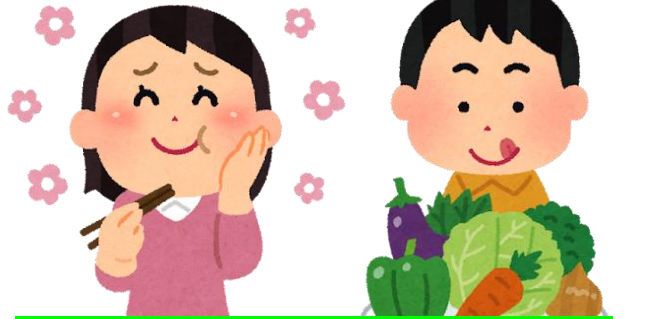
美味しく食べて美味しく健康！