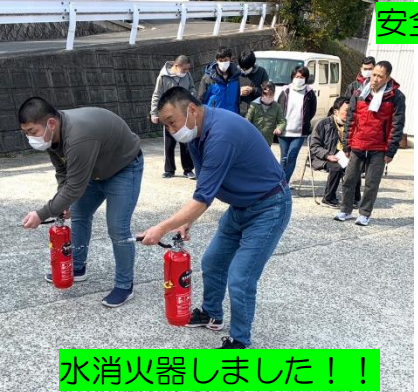
水消火器しました！！