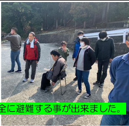
安全に避難する事が出来ました。

みなさん最初は驚かれた様子でしたが、職員の声掛けをしっかりと聞いて逃げ遅れる事なく全員無事に避難をする事ができました。そして今回は水消火器の訓練も行っています。狙った場所に水をかける事ができる方や少し違った方向にいく方もいましたが、みなさん真剣に取り組む事ができていました。全員消火器の訓練を終え、これで今年度最後の避難訓練も怪我無く無事に終了です。今後ともこうして定期的に避難訓練を行う事で、火災や震災などの危険性を忘れず意識していきたいです。今年度も大変お世話になりました。来年度もウエス一同よろしくお願いたします。