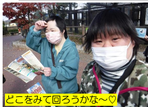
どこをみて回ろうかな〜♡