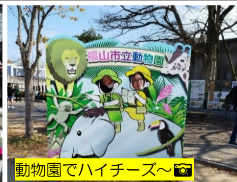
動物園でハイチーズ〜📷