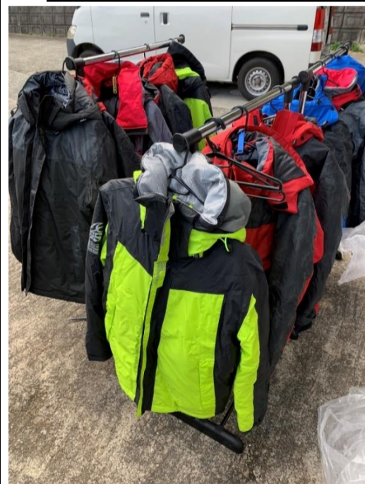
寒さ対策にも気をつけて行きます