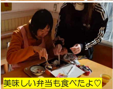
美味しい弁当も食べたよ♡