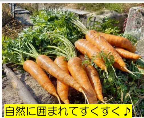
自然に囲まれてすくすく♪

これからも、見た目だけでなく、味もより良いものを目指して、試行錯誤を重ねファーム部署みんなで野菜を栽培していきたいと思えます。