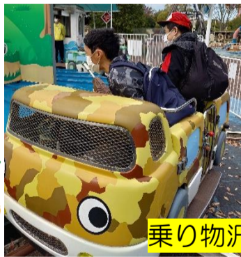
乗り物沢山乗ったね〜♪