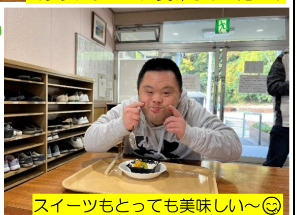
スイーツもとっても美味しい〜😊