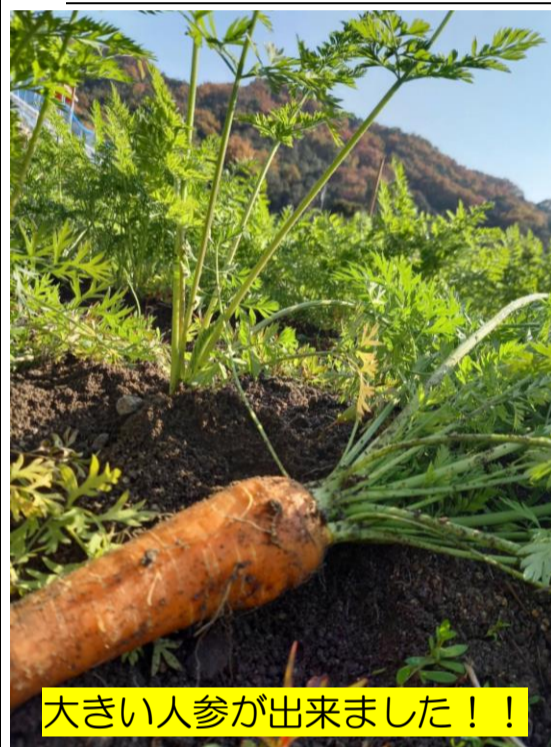
大きい人参が出来ました!!