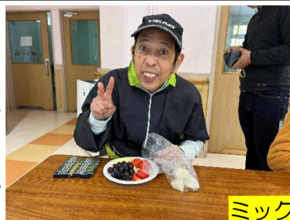
ミックスジュース美味しかった〜♡