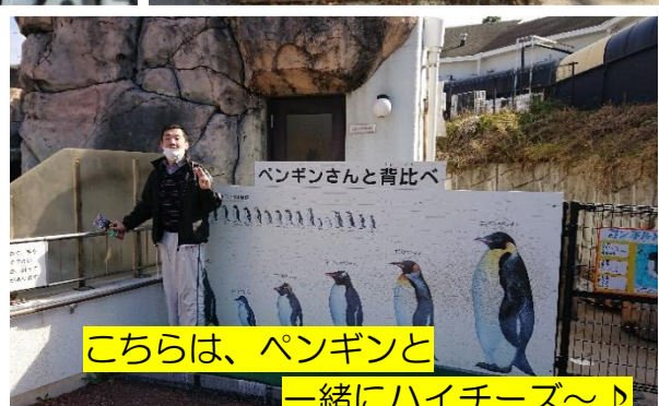
こちらは、ペンギンと一緒にハイチーズ〜♪