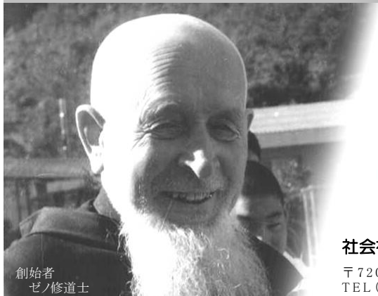
創始者 ゼノ修道士

発行人 寶子丸 周吾 編集 ふれあい編集委員会 題字 大楽 華雪 (元毎日書道会 常任顧問)